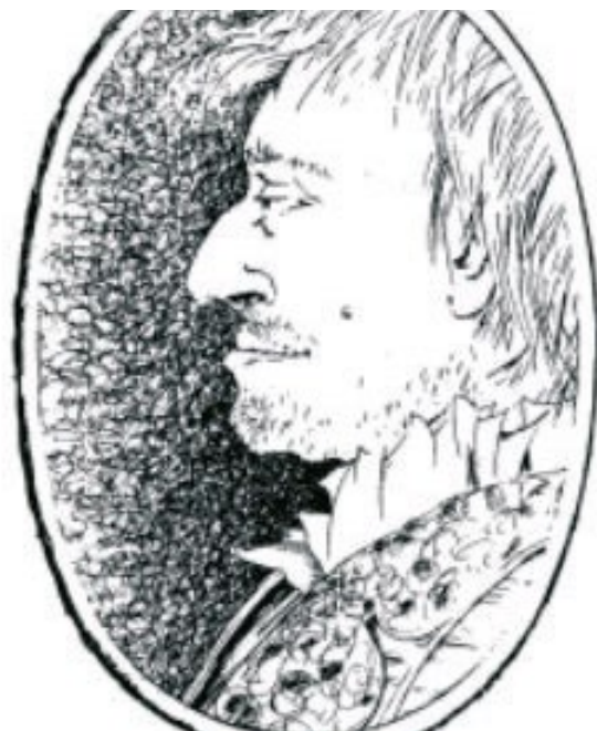
Dessin issu de l'imagination du frère Bernard-Marie Albert, moine de l'Abbaye St-Paul de Wisques

A 60 ans, trop fatiguée et ne pouvant plus monter à cheval, elle prit sa retraite de louvetière dans son château de Zutkerque (qui existe encore) où elle mourut à l'âge de 75 ans. Elle reste toujours une célébrité dans le Nord, plusieurs chansons racontant ses exploits lui sont dédiées.