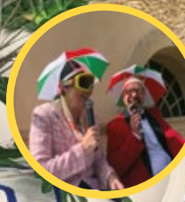
P.10 Les carriolades