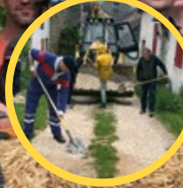
P.6 La journée citoyenne