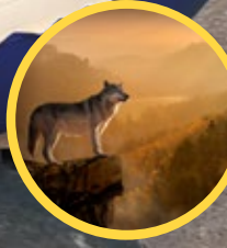
P.14 Le loup