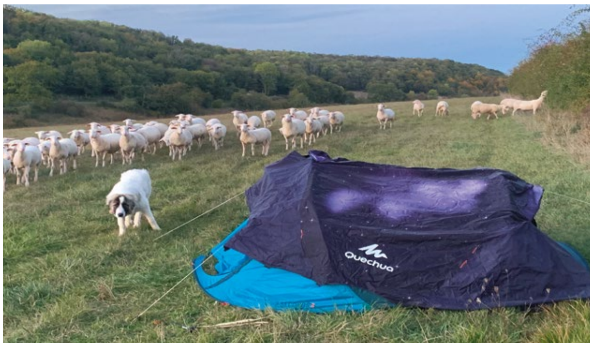
Campement de Christophe Girardet, bénévole Pastoraloup pour la ferme du Poiset le 14 octobre 2023

Pastoraloup propose aussi des équipes qui aident à mettre en place des clôtures.