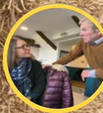
P.9 Le restau